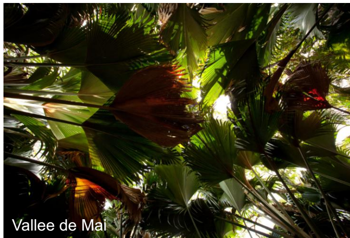
Vallee de Mai

Heute geht es zunächst nach Praslin, der zweit größten bewohnten Insel der Seychellen. Hier gehen Sie von Bord, um das berühmte Vallee de Mai zu besuchen – das zum Weltnaturerbe der UNESCO erklärt wurde. Hier ist die riesige, eigenartig geformte Kokosnuss, die Coco de Mer heimisch und auch der Black Parrot, der nur auf Praslin vorkommt. Erkunden Sie die verschlungenen Pfade des Vallee de Mai unter dem Blätterdach der riesigen Palmen bevor Sie an Bord zurückkehren, um am Nachmittag Möglichkeiten zum Tauchen und Schnorcheln zu nutzen oder anderen Wassersportarten nachzugehen.