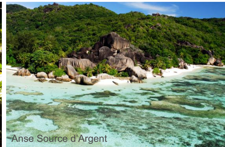
Anse Source d'Argent

Morgens erreichen Sie La Digue, eine verschlafene Insel auf der Ochsenkarren und Fahrräder die Hauptverkehrsmittel darstellen. La Digue ist Heimat des endemischen Paradise Flycatchers und ist besonders bekannt für die eindrucksvollen Granitformationen an der Source d'Argent, einen der am meisten fotografierten Strände der Welt. Am Besten erkundet man die Insel mit dem Fahrrad und legt eine Pause im Union Estate ein, wo man mit den traditionellen Beschäftigungsarten der Insel vertraut gemacht wird: Kokosölmühle, Bootswerft und Vanillepflanzungen.